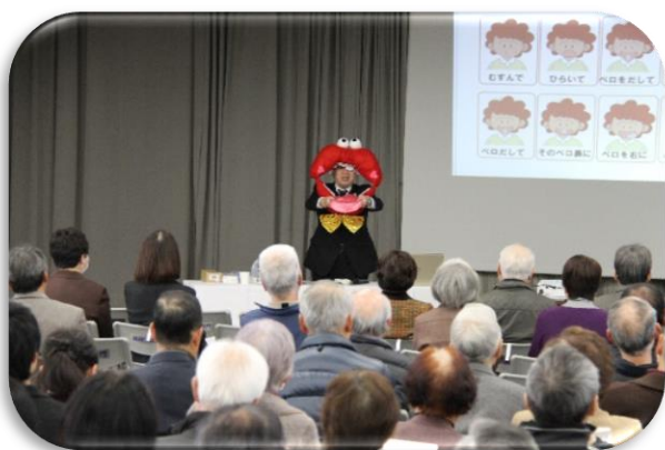
第53回鳴門市社会福祉大会

発行 / 社会福祉法人 鳴門市社会福祉協議会 〒772-0003 鳴門市撫養町南浜字東浜 24 番地 2 鳴門健康福祉交流センター2F TEL : 088-685-7170 FAX:088-686-4059 HP : http://www.narutoshi-shakyo.com