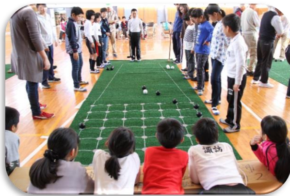
里浦地区「囲碁ボール大会」 ～若い世代の地域活動への参加～