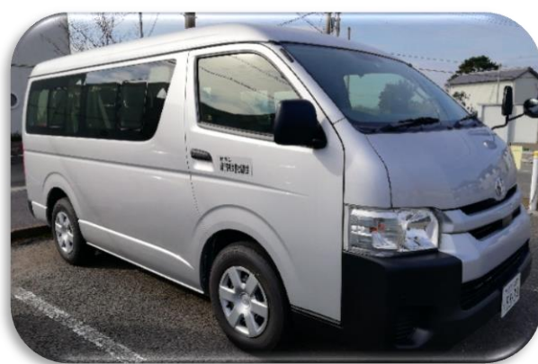
公用車貸出（トヨタハイエース）